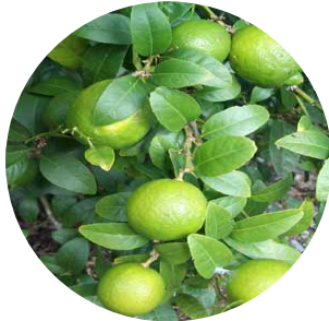
Cosecha del producto