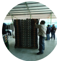
Transportación Del producto