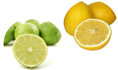
Empaque del producto